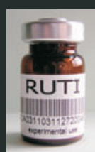
La nova vacuna que s'està experimentant a Can Ruti